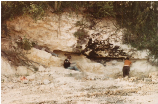
Fig.16- Exploitation du lutétien dans la carrière 1 en 1978