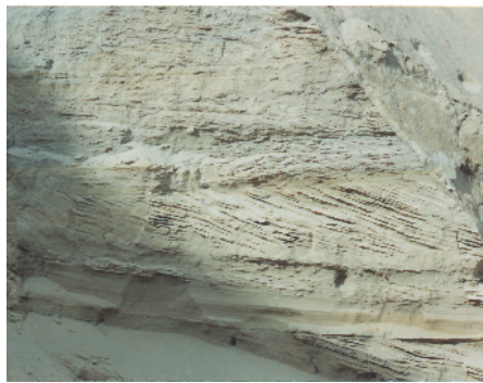
Fig.27 – Stratifications entrecroisées de la couche 5 (Août 1990)