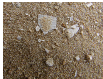
Fig.56 – Aspect du sable de la couche 11